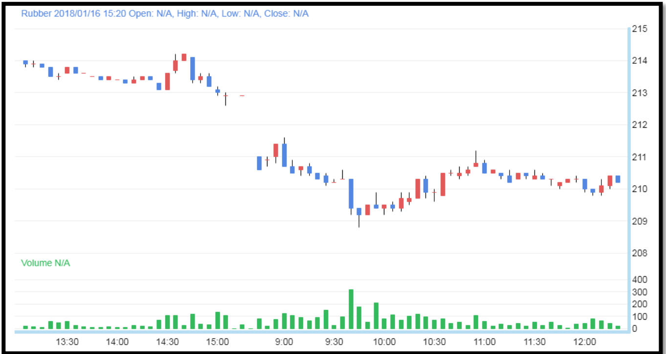
Chart For TOCOM

บริษัท ดีเอส ฟิวเจอร์ส จำกัด 56/16 อาคารบิสโก้ทาวเวอร์ ชั้น 13B ถนนทรัพย์ แขวงสี่พระยา เขต บางรัก กรุงเทพฯ 10500 โทรศัพท์ 02 -637-0707 โทรสาร 02 - 637 -1072 Email : info@dsfutures.co.th Website : http://www.Dsfutures.co.th